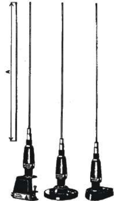
AMG 450 AMM 450 AMB 450